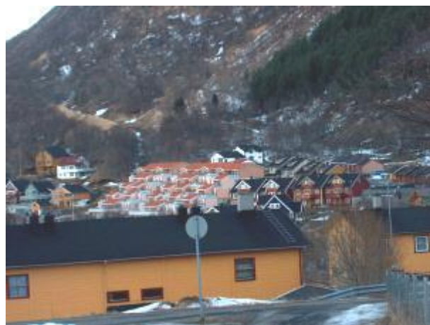
Utsikt fra skolen mot Solgården Terrasse.