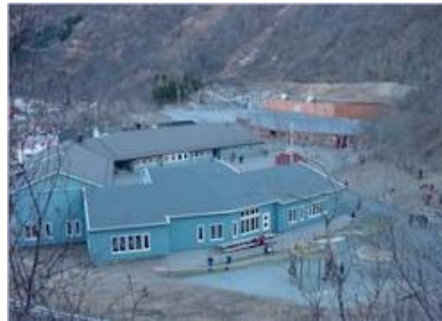
Løpsmark skole: Aspen, Tunet og Smia m/Nordstrandahallen

I 1980 bodde det 624 innbyggere her, og man antok at det i 2000 ville øke til 1306 i kretsen. I 2002 bodde det 3239 på Norsia, hvorav drøye 2000 bodde i vår skolekrets.